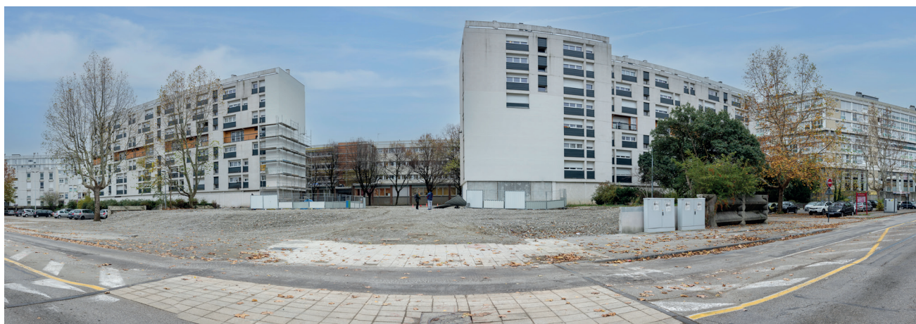
La démolition des 1, 2 Armor et 10 Ouessant