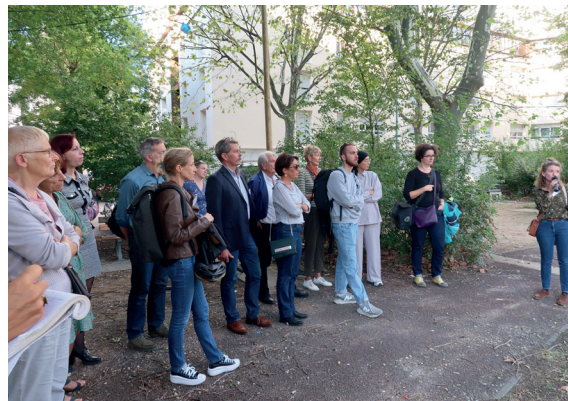
Une déambulation a eu lieu dans le quartier en septembre dernier. L'occasion de parler des nouveaux projets et des chantiers en cours.

Enfin, les participants approuvent la démolition des 29 logements au Saintonge, qui permettra d'ouvrir le quartier et de créer des espaces publics plus grands et de meilleure qualité. La liaison du secteur Saintonge avec le projet Allibert est perçue de manière positive, en particulier pour rejoindre à terme le quartier Beauvert par des cheminements piétons de qualité.