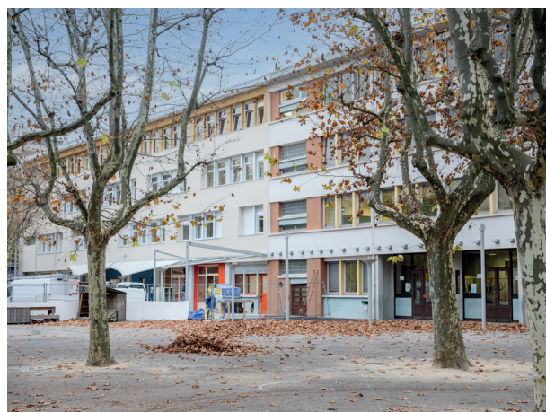
La rénovation de l'école élémentaire Jean-Paul Marat