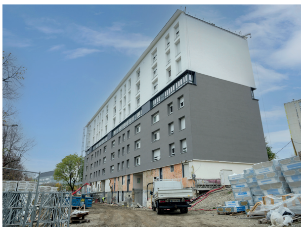
La réhabilitation du Limousin