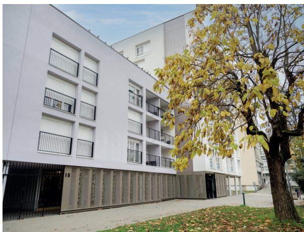
La réhabilitation du 4 au 22 Maine

L A R E N O V A T I O N U R B A I N E E N I M A G E S