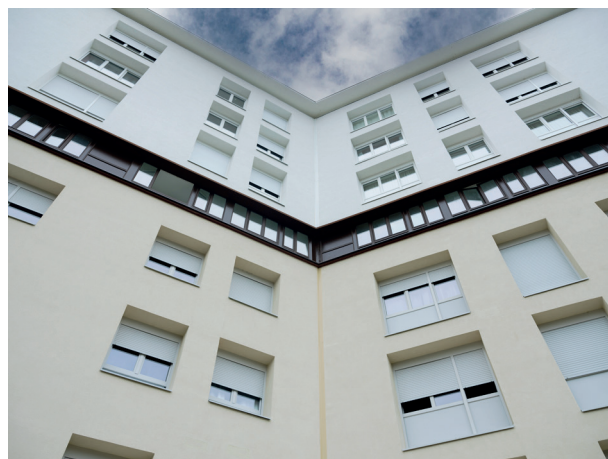
La réhabilitation du Vivarais